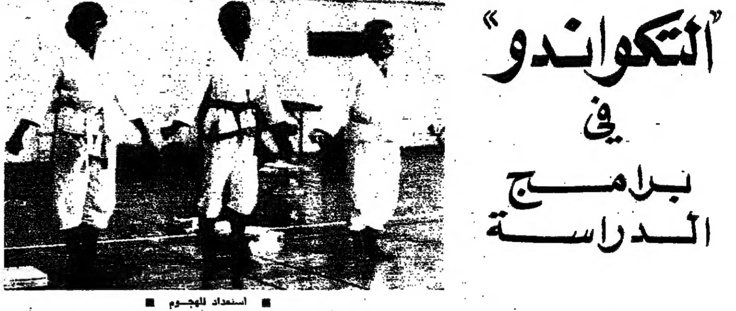
استعداد للهجوم ■